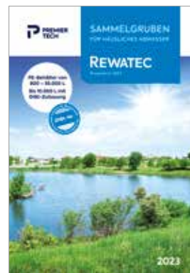
Prospekt Sammelgruben 2023 (Bestell-Nr. INAW2099)