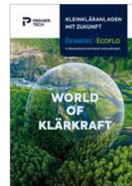
Prospekt World of Klärkraft (Bestell-Nr. INAW2219)

Die Aktionspreise sind bei Bestellung bis zum 15.12.2023 gültig. Die Abnahme muss innerhalb von 4 Wochen erfolgen. Sämtliche Preise inkl. gesetzlicher Mehrwertsteuer. Technische Änderungen und Irrtümer vorbehalten. Lieferung innerhalb von 10 Werktagen (rechtlich nicht bindend).